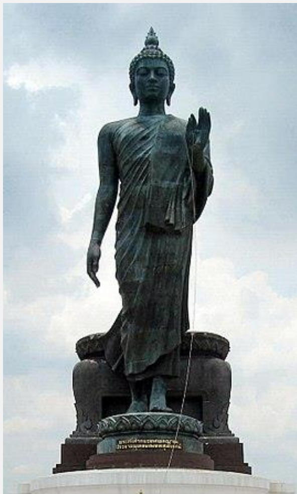
พระพุทธรูปประธานที่พุทธมณฑล