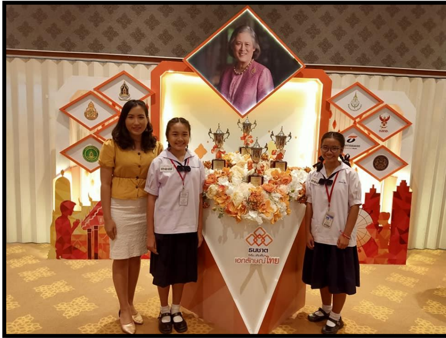
ภาพที่ ๑ “การแข่งขันอ่านฟังเสียง” ครั้งที่ ๔๘ ประจำปี ๒๕๖๒ ซึ่งถ้วยพระราชทาน สมเด็จพระกนิษฐาธิราชเจ้า กรมสมเด็จพระเทพรัตนราชสุดาฯ สยามบรมราชกุมารี ระดับชั้นมัธยมศึกษาตอนต้น (ม.๑-๓) วันพุธ ที่ ๓๑ กรกฎาคม ๒๕๖๒ ณ ธนาคารธนชาติ จำกัด (มหาชน) ห้องศาลาสวนมะลิ ชั้น ๒ อาคารสวนมะลิ กรุงเทพมหานคร