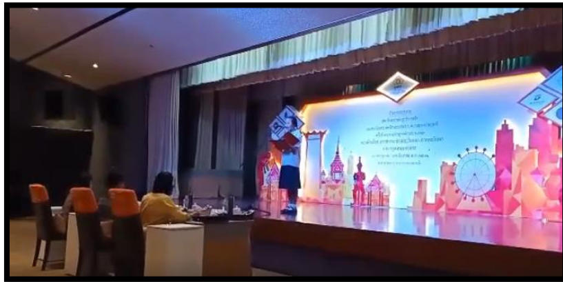
ภาพที่ ๒ บรรยากาศการแข่งขันของ เด็กหญิงปราณปรียาภา สวางค์ ชั้น ม.๑/๑๓