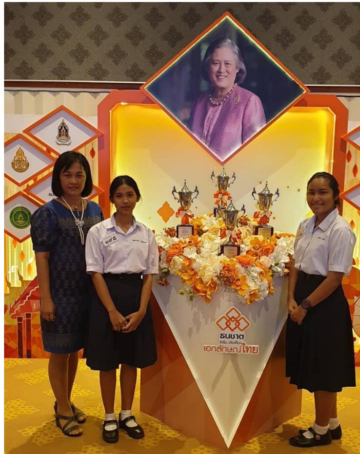
ภาพที่ ๔ “การแข่งขันอ่านฟังเสียง” ครั้งที่ ๔๘ ประจำปี ๒๕๖๒ ซึ่งด้วยพระราชทาน สมเด็จพระกนิษฐาธิราชเจ้า กรมสมเด็จพระเทพรัตนราชสุดาฯ สยามบรมราชกุมารี ระดับชั้นมัธยมศึกษาตอนปลาย (ม.๔-๖) วันศุกร์ ที่ ๒ สิงหาคม ๒๕๖๒ ณ ธนาคารธนชาติ จำกัด (มหาชน) ห้องศาลาสวนมะลิ ชั้น ๒ อาคารสวนมะลิ กรุงเทพมหานคร